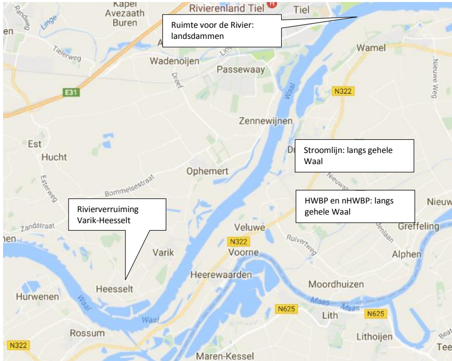
Figuur 2.2: Projecten in de omgeving.